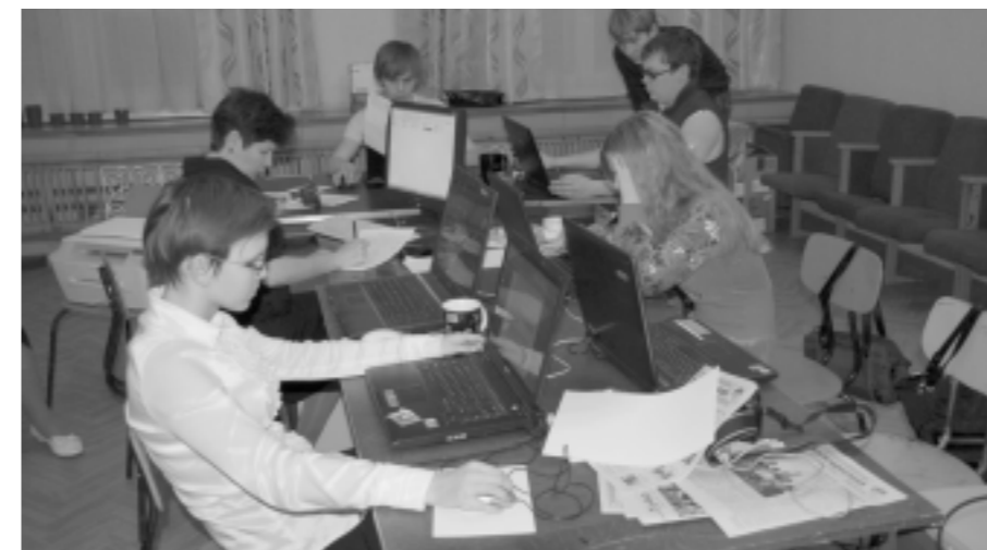
Неспящие в пресс-центре

КСТАТИ Итоги фестиваля «Журналина-2010» смотри на восьмой странице.