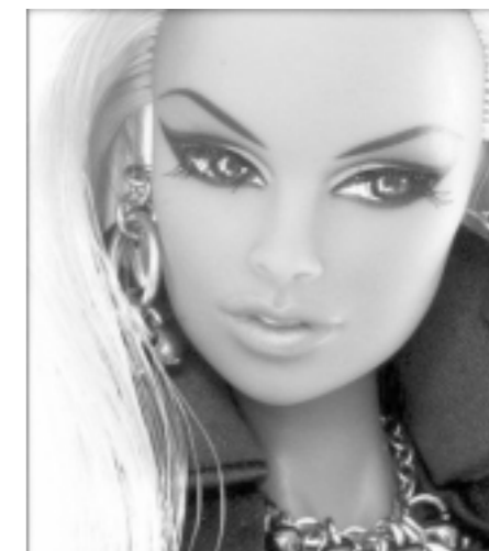
Куклы выходят из моды

— Моё мнение — лучше натуральная, естественная девушка. Не люблю «кукол». Кукла есть кукла — поиграл, сломалась, выкинул. А естественная красота — очень даже круто, потому что это редкость. Всё же при этом я знаю массу девушек, которые никогда не переделывали себя, но, как говорится, всё при них. Следить за собой нужно! А «куклы» выходят из моды. Даже страшно представить, что с ними будет лет через пять. Девчонки, будьте такими, какие вы есть, без мишуры вы классные!