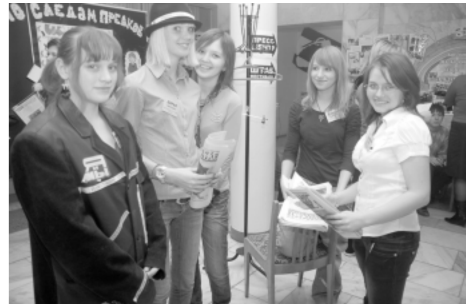
Команда копейского центра детских СМИ «Я и Мы»

Ещё одно традиционное мероприятие «Журналины» фотокросс (уже пятый по счёту). За десять часов необходимо сделать семь снимков на заданные темы. Например, «Челябинские журналисты настолько суровые...», «И так всё понятно», плюс одно задание на «контрольной точке». Помучались, но сделали.